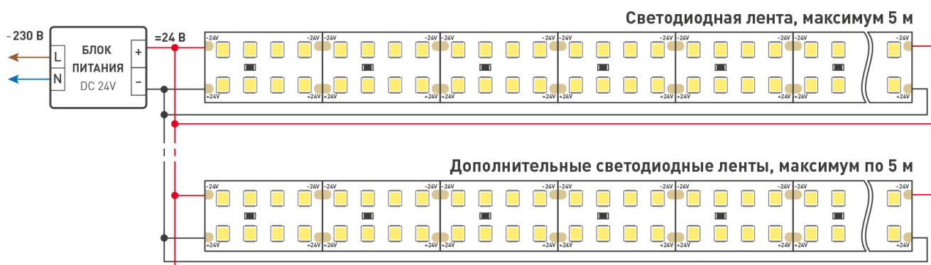
Схема 1. Подключение нескольких светодиодных лент с одной стороны.

Максимальная длина подключения ленты – 5 м (1 катушка).